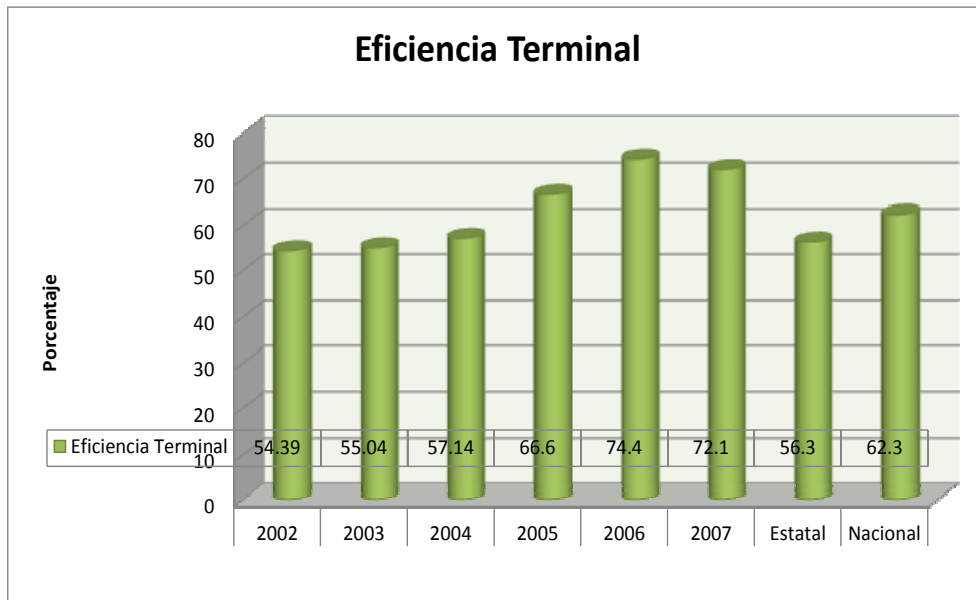
Gráfica 1.8.1 Eficiencia terminal global histórica

Egreso global vs. Eficiencia terminal Estatal y Nacional