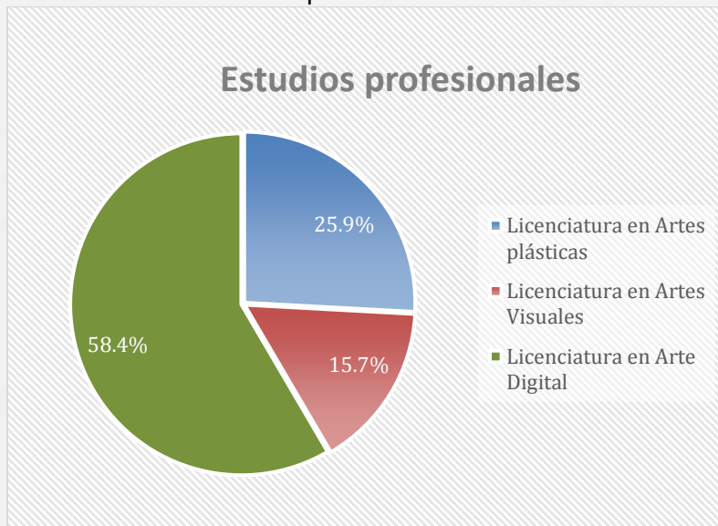
Gráfico 1. Matrícula de estudios profesionales