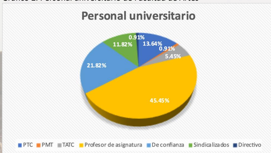
Gráfico 2. Personal universitario de Facultad de Artes